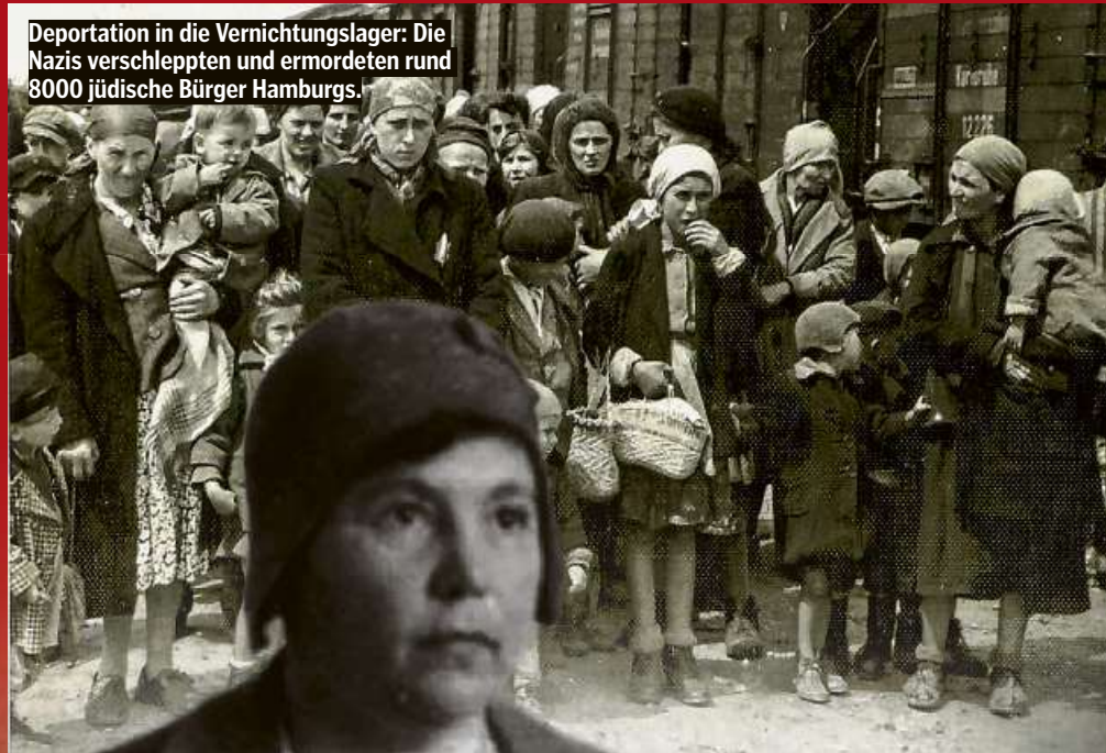
Deportation in die Vernichtungslager: Die Nazis verschleppten und ermordeten rund 8000 jüdische Bürger Hamburgs.