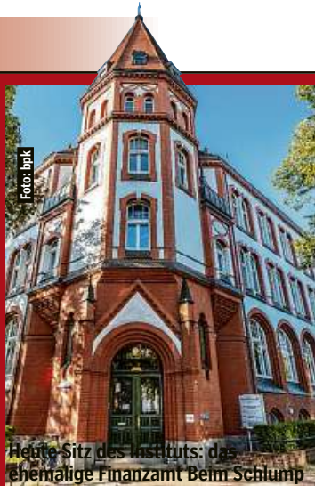
Heute-Sitz des Instituts: das ehemalige Finanzamt Beim Schump

Der juristische Streit ist damit beendet. Aber der politische noch lange nicht.