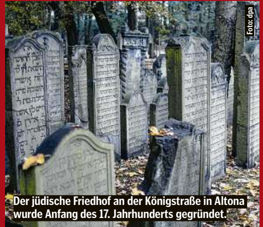
Der jüdische Friedhof an der Königstraße in Altona wurde Anfang des 17. Jahrhunderts gegründet.