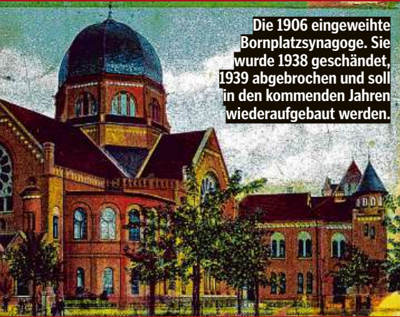
Die 1906 eingeweihte Bohnplatzsynagoge. Sie wurde 1938 geschändet, 1939 abgebrochen und soll in den kommenden Jahren wiederaufgebaut werden.